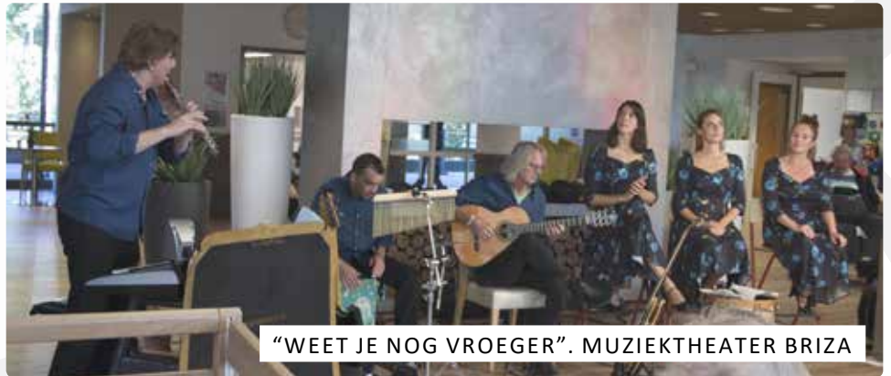
"WEET JE NOG VROEGER". MUZIEKTHEATER BRIZA