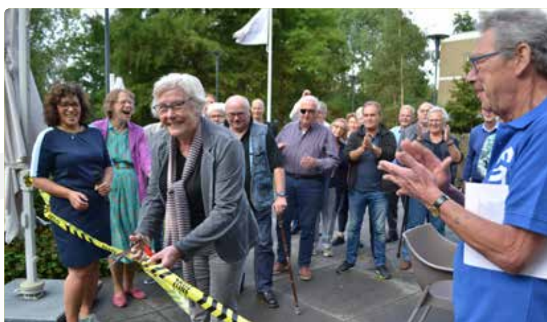
Aan Trees de eer voor de officiële opening

De officiële opening was een hele happening waar aardig wat mensen op af zijn gekomen.