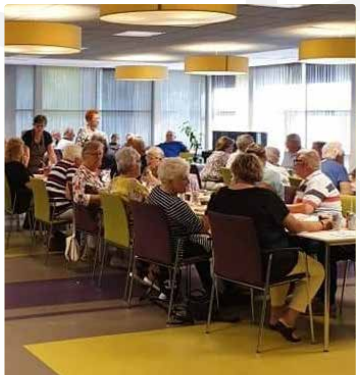
De bbq van 30 augustus jl. was, zoals u op de foto's ziet, weer een succes!