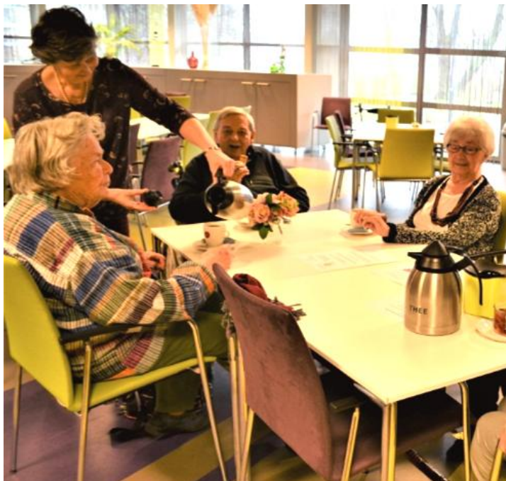
Zoals het in het ontmoetingscentrum was vóór corona...

Helaas nog wel in beperkte vorm omdat we ons aan de maatregelen van de overheid (moeten) houden. Maar de receptie- en barvrijwilligers zijn op de hoogte gebracht en zijn enthousiast om u weer te ontvangen.