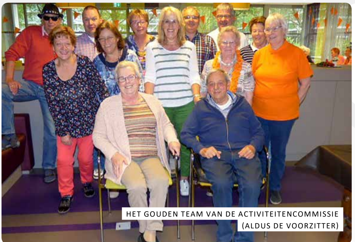
HET GOUDEN TEAM VAN DE ACTIVITEITENCOMMISSIE (ALDUS DE VOORZITTER)

Al met al een eerste helft van het jaar 2018 dat op 22 juni afgesloten is met het Hazeskoor en dus bol stond van de activiteiten. En we gaan zo natuurlijk de rest van het jaar weer verder dankzij alle kanjers van de Activiteitencommissie. Dus blijf de kalender in de gaten houden.